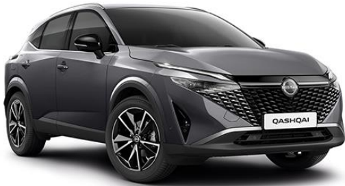
Темно-сірий – KAD