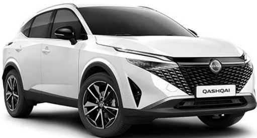
Перлинно-білий – QBE