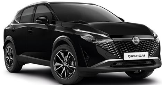
Чорний перламутр – GAT