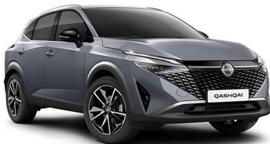
Сірий перламутр – KBV