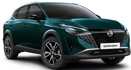
Синьо-зелений преміум – FAP