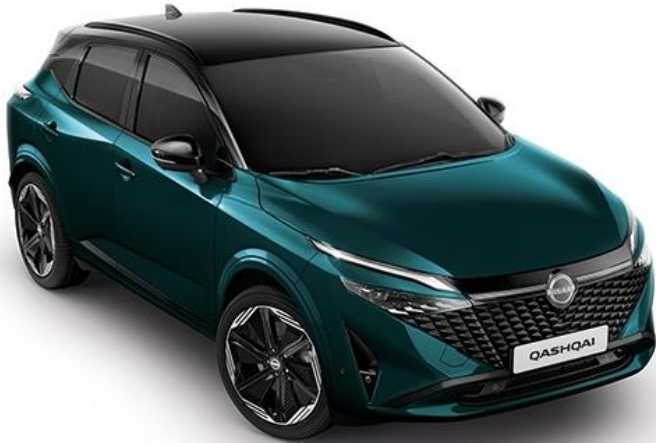
Синьо-зелений преміум + дах чорного кольору - YBJ

Текна: +37 840 грн (включно з вартістю фарби преміум/перламутр) N-Design / Текна+ : стандартне обладнання