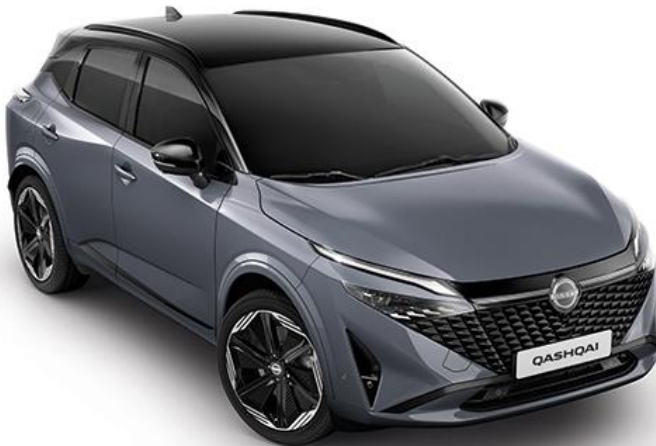
Сірий перламутр + дах чорного кольору - XEX