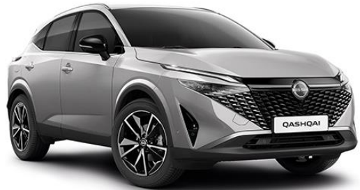
Сріблястий – KYO