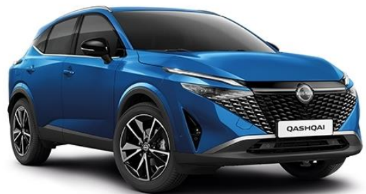
Лазурний перламутр – RCF