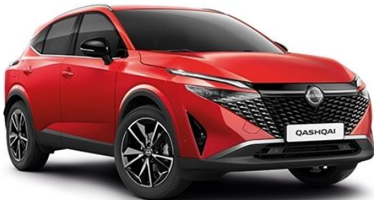
Червоний Fuji Sunset – NBV