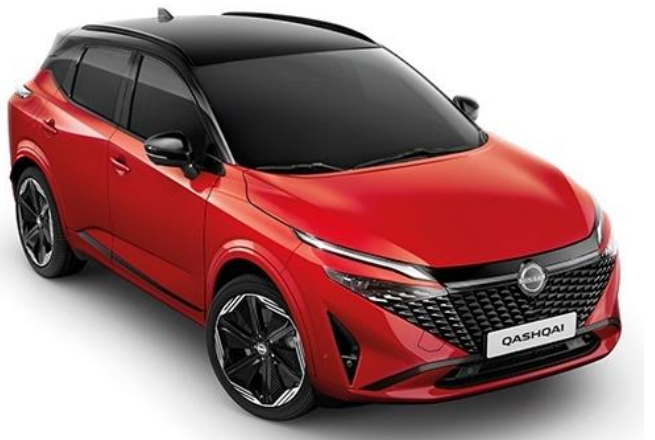
Червоний Fuji Sunset + дах чорного кольору - YAU