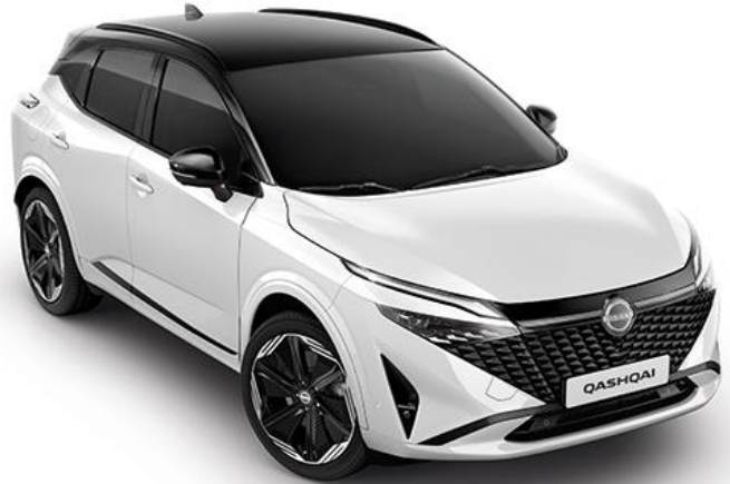
Перлинно-білий + дах чорного кольору - XKJ