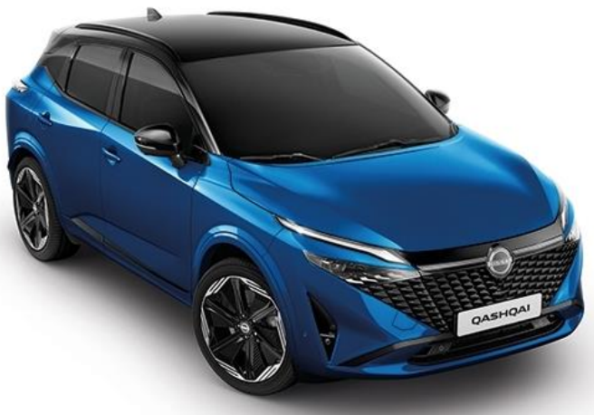
Лазурний перламутр + дах чорного кольору - XGZ