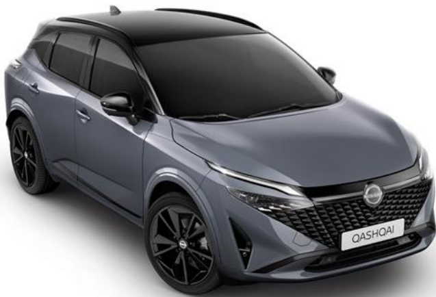
Сірий перламутр + дах чорного кольору - XEX