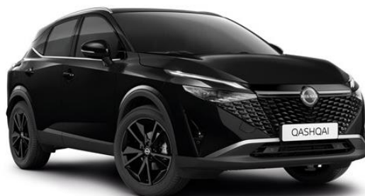
Чорний перламутр - GAT