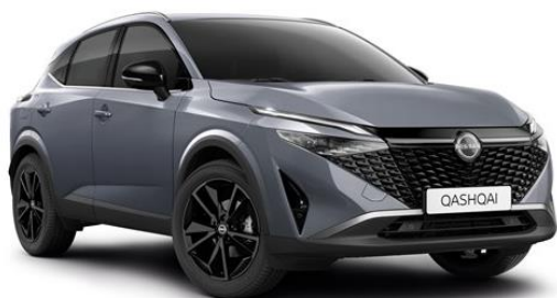
Сірий перламутр - KBY