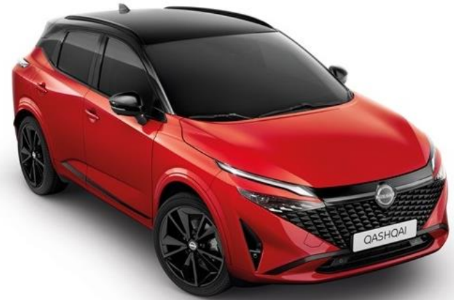
Червоний Fuji Sunset + дах чорного кольору - YAU