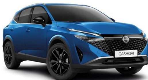
Лазурний перламутр - RCF