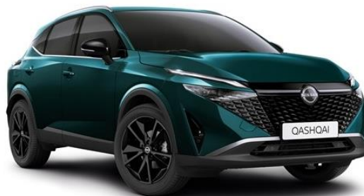
Синьо-зелений преміум - FAP