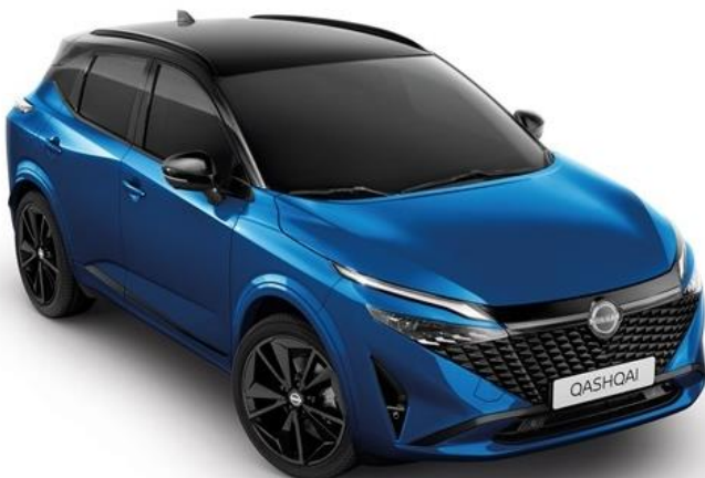
Лазурний перламутр + дах чорного кольору - XGZ